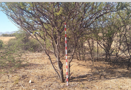
Im Gelände werden dezidiert Parameter zu den Gehölzen erfasst.