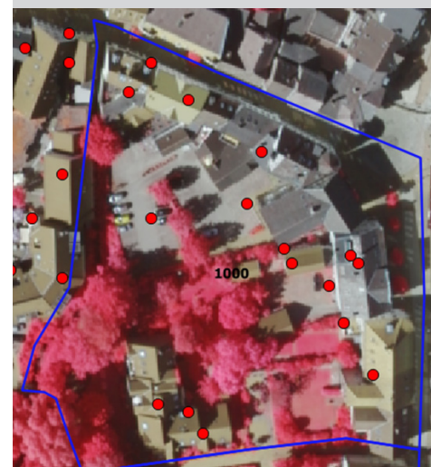
Beispiel zur Trainingsdatenableitung in Cop4ALL: Referenzpunkte der Landbedeckungsklasse Versiegelung (rot markiert) abgeleitet aus einem Polygon der Objektart AX_Wohnbauflaeche (blau).

Die Arbeitsgemeinschaft der Vermessungsverwaltungen der Länder der Bundesrepublik Deutschland (AdV) hat beschlossen, die Landbedeckung und Landnutzung im amtlichen Vermessungswesen einzuführen. Bis Ende 2023 wollen die Verwaltungen die Daten der Landbedeckung flächendeckend für Deutschland bereitstellen. Der NRW-Ansatz unterstützt das Motto „Einer für Alle“, so dass alle Bundesländer profitieren sollen. Cop4ALL hat also mit dieser Komposition der Datenbausteine zur Skalierung der Sentinel-Information das Potenzial zum „State of the art“.