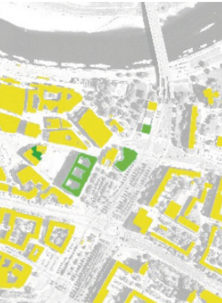
Kartenausschnitt der Gründach- erfassung für Dresden. Grün = Gründach, gelb = konventionelles Dach.