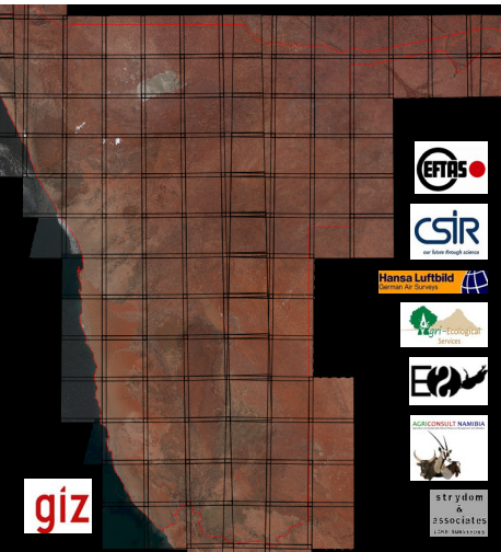
Mosaik aus Sentinel-2 Daten von Namibia. Das BIS wird im Auftrag der Deutschen Gesellschaft für Internationale Zusammenarbeit (GIZ) entwickelt. Die BIS-Projektpartner sind die Münsteraner Unternehmen EFTAS und Hansa Luftbild, das Council for Science and Industrial Research aus Südafrika sowie aus Namibia AGRICONSULT NAMIBIA, Strydom & Associates Land surveyors, Namibia Ecosystem Services und Agri-Ecological Services.